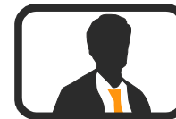
Operador Sala Plenos