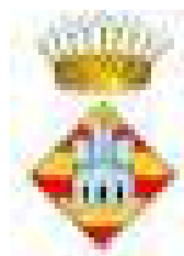
Ajuntament de Castelló d'Empúries