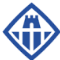
AJUNTAMENT DE Vilanova i la Geltrú